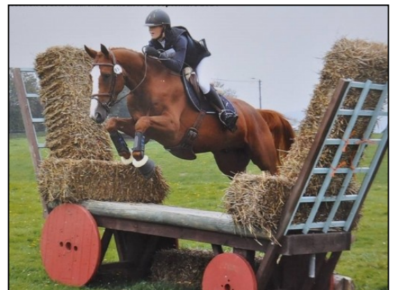
Lola Madrenas Elios des Concessions EWalCo Etalon, 5 ans (Baloubet du Rouet x Paladin des Ifs) Eleveur : Haras des Concessions